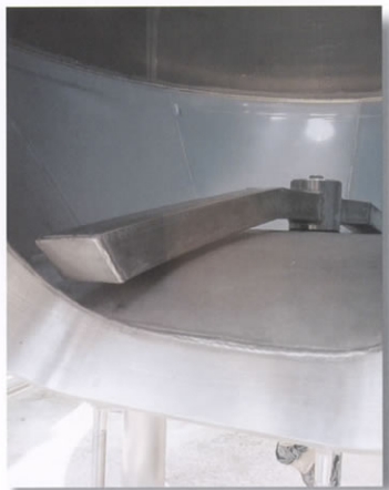
■ Raschiatore rotante.