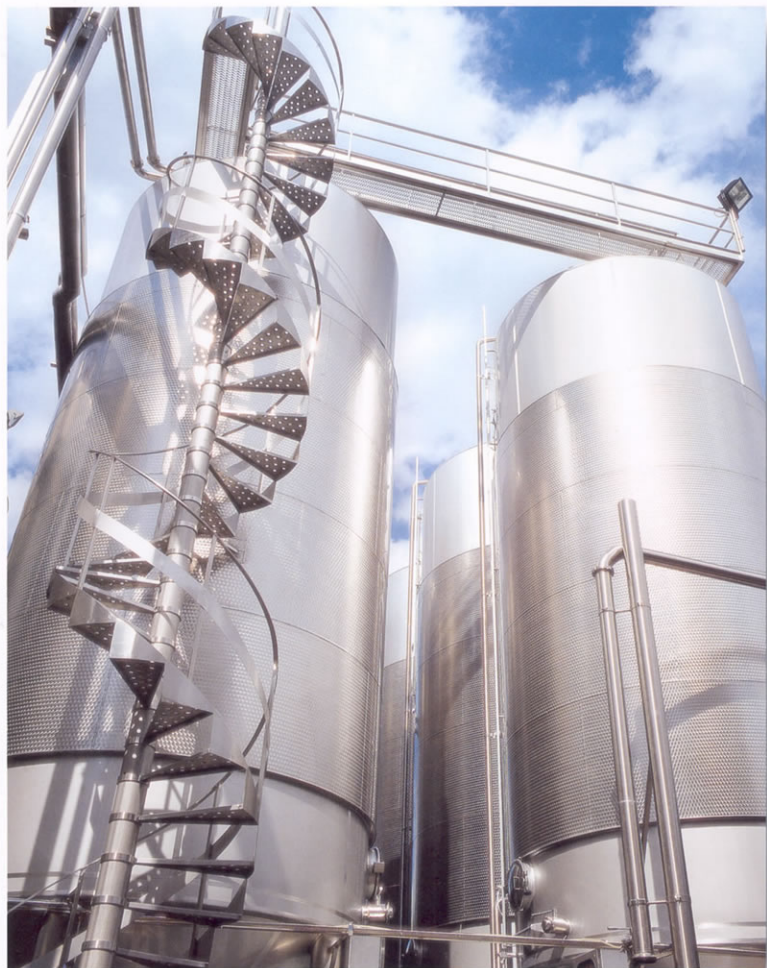
■ Vinificatori da 800 hl.