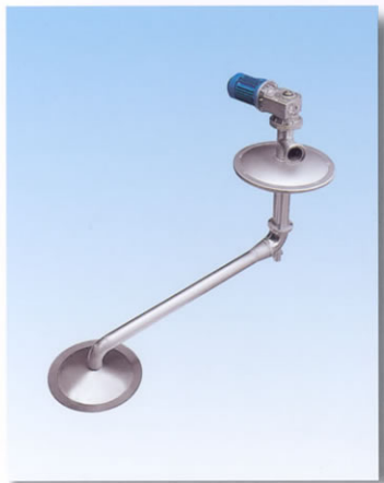
■ Irroratore motorizzato.