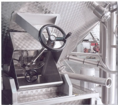
■ Portella per scarico vinacce.