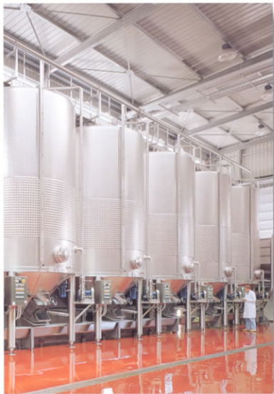
■ Vinificatori da 300 hl.