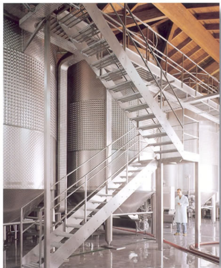
■ Vinificatori da 500 hl.