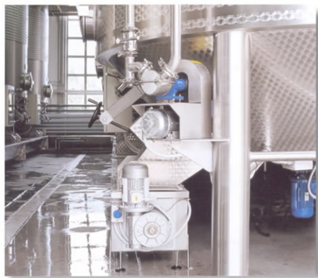
■ Particolare inferiore del vinificatore.