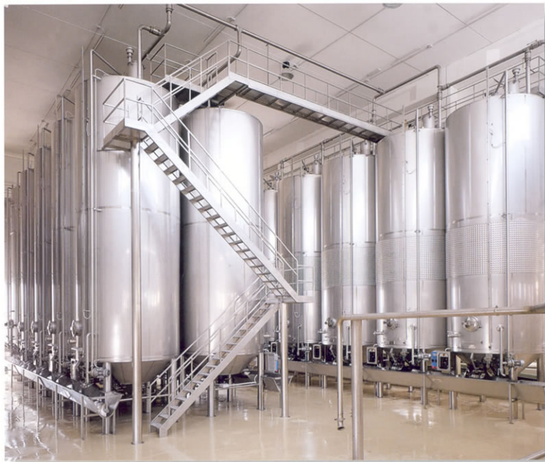
■ Vinificatori da 500 hl.