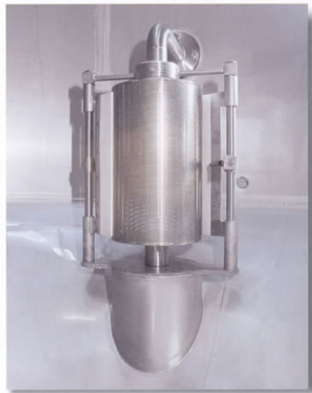
■ Filtro auto pulente.